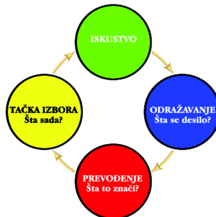
MODEL TAČKE IZBORA (ciklus učenja kroz iskustvo)

Moćni programi učenja kroz iskustvo mogu se bazirati na modelu „TAČKE IZBORA“ (Point of Choice model).